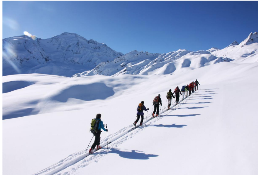
Verlässt man die Normalspur, so eröffnen sich viele unberührte Geländekammern. Bei solchem Wetter eine Freude!